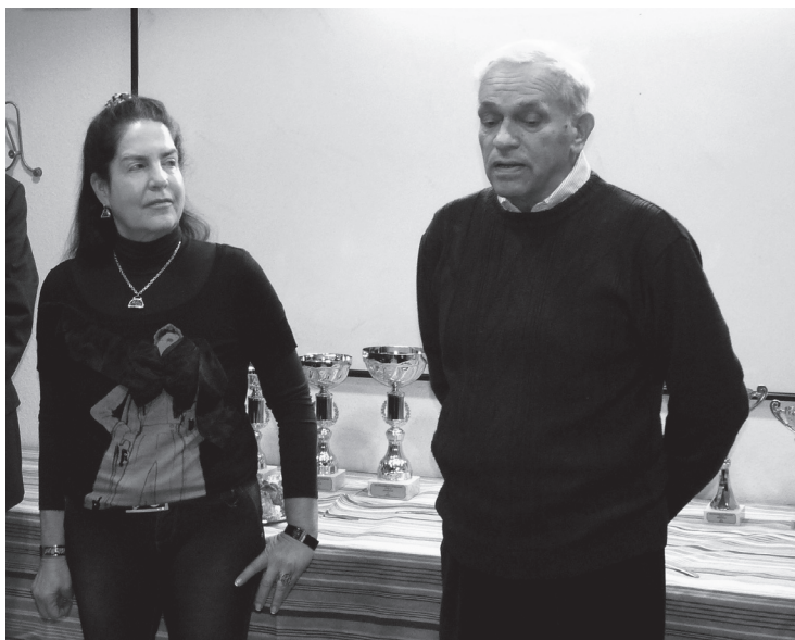
Körmöczi Zsuzsa Emlékverseny fogadása

Szövetség a Magyar Veterán Teniszezőkért